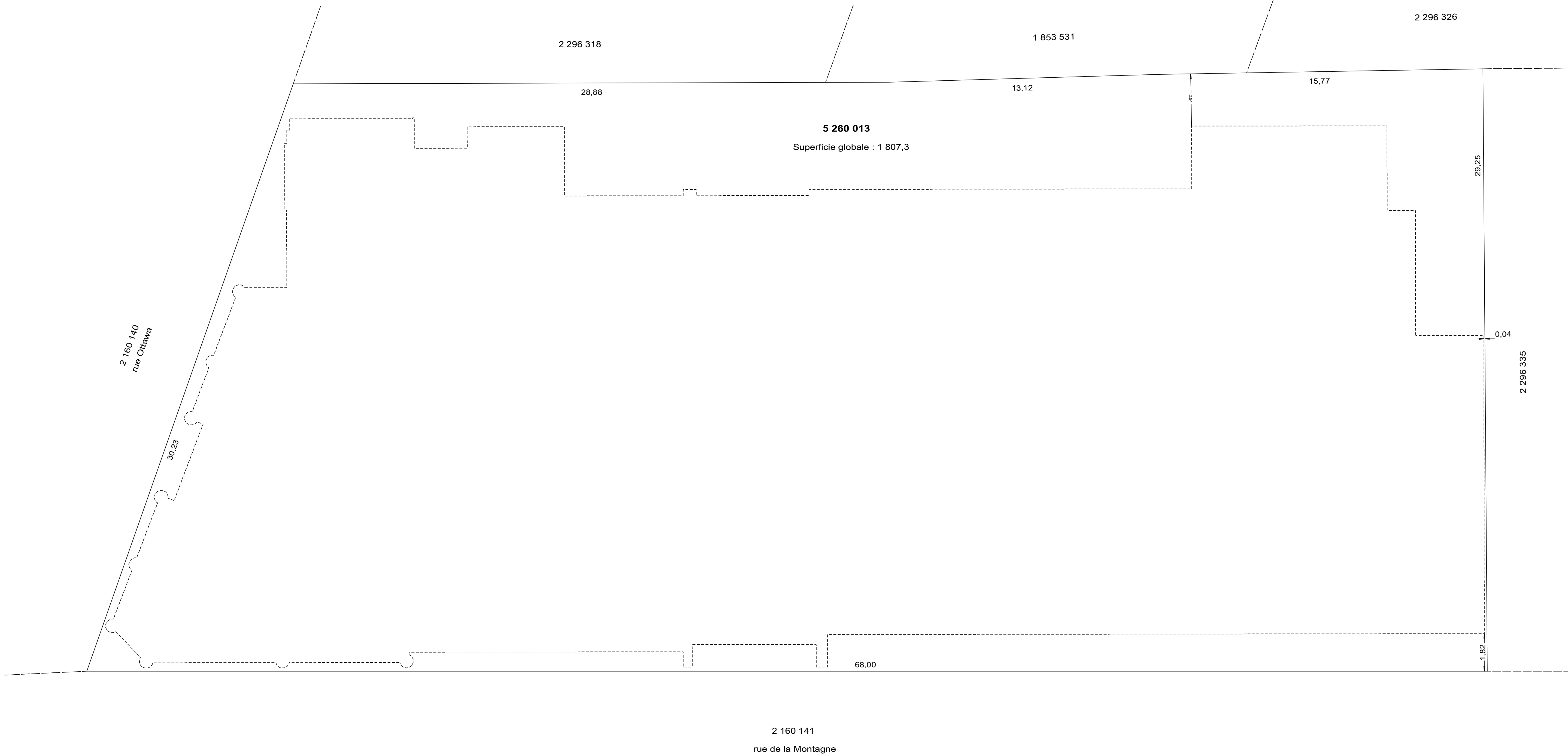
Vue de localisation